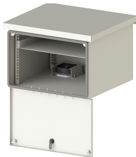
Bandeja para equipamentos 1